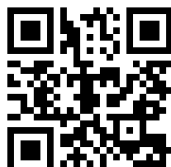
「初創專區」 精采片段回顧